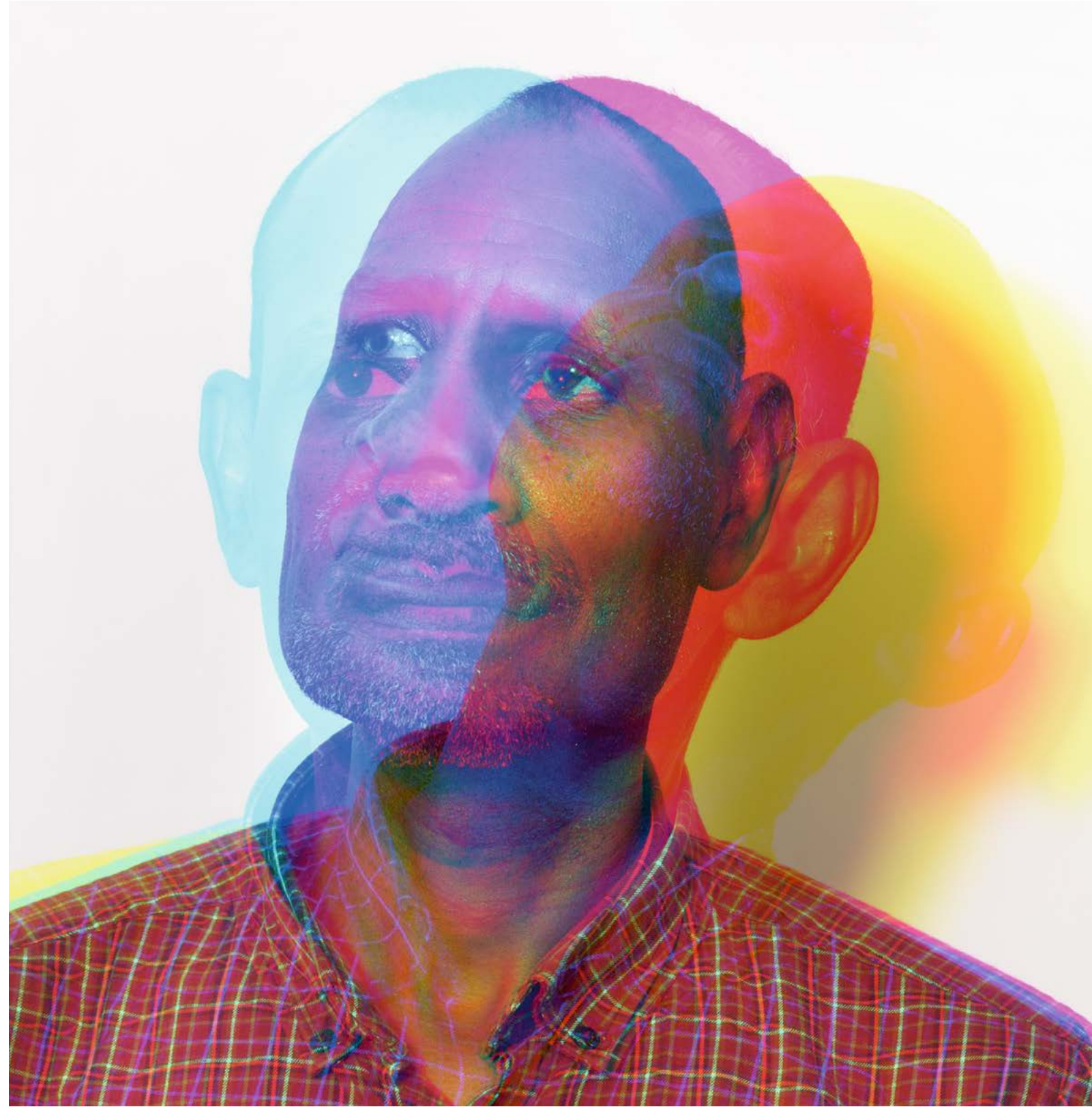
14 – 15