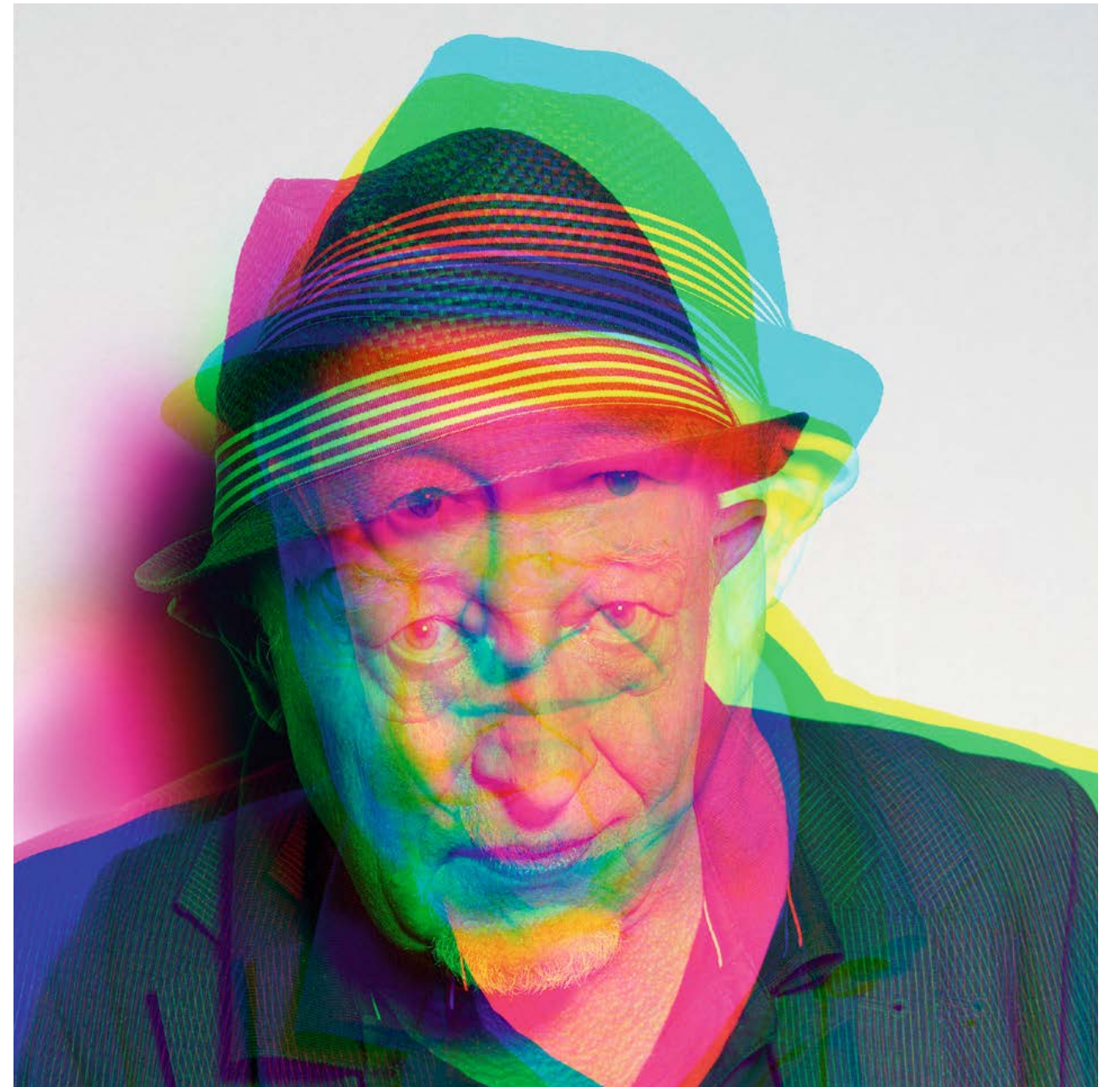
20 – 21