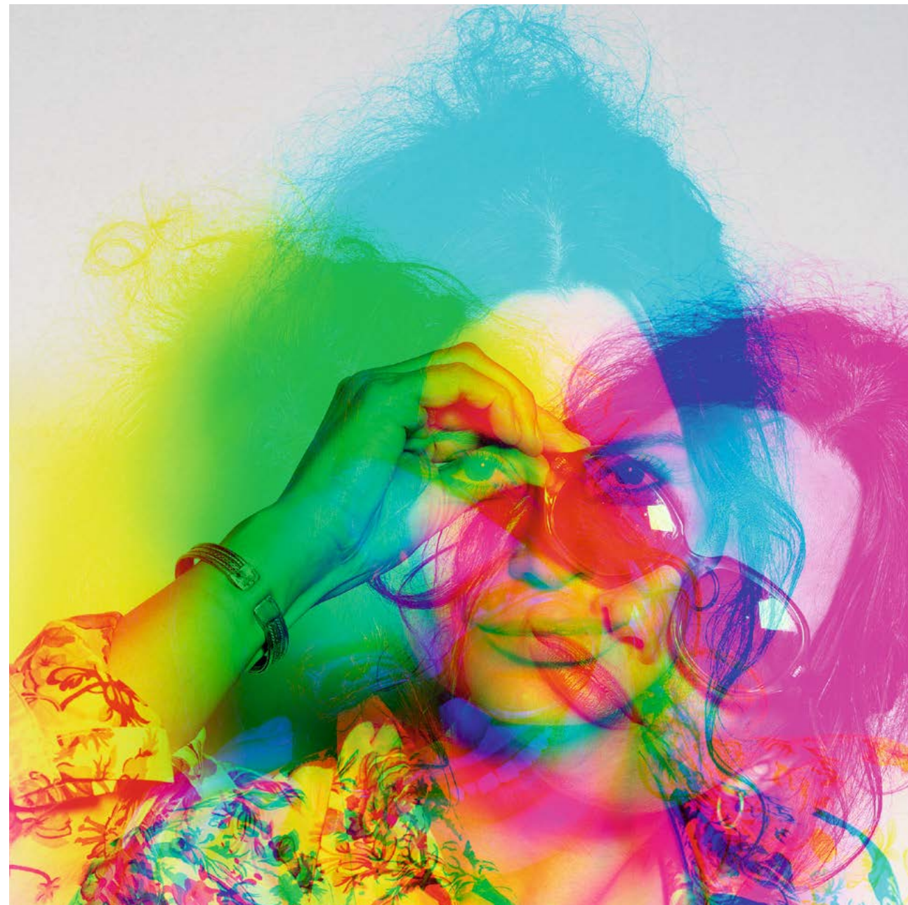
12 – 13