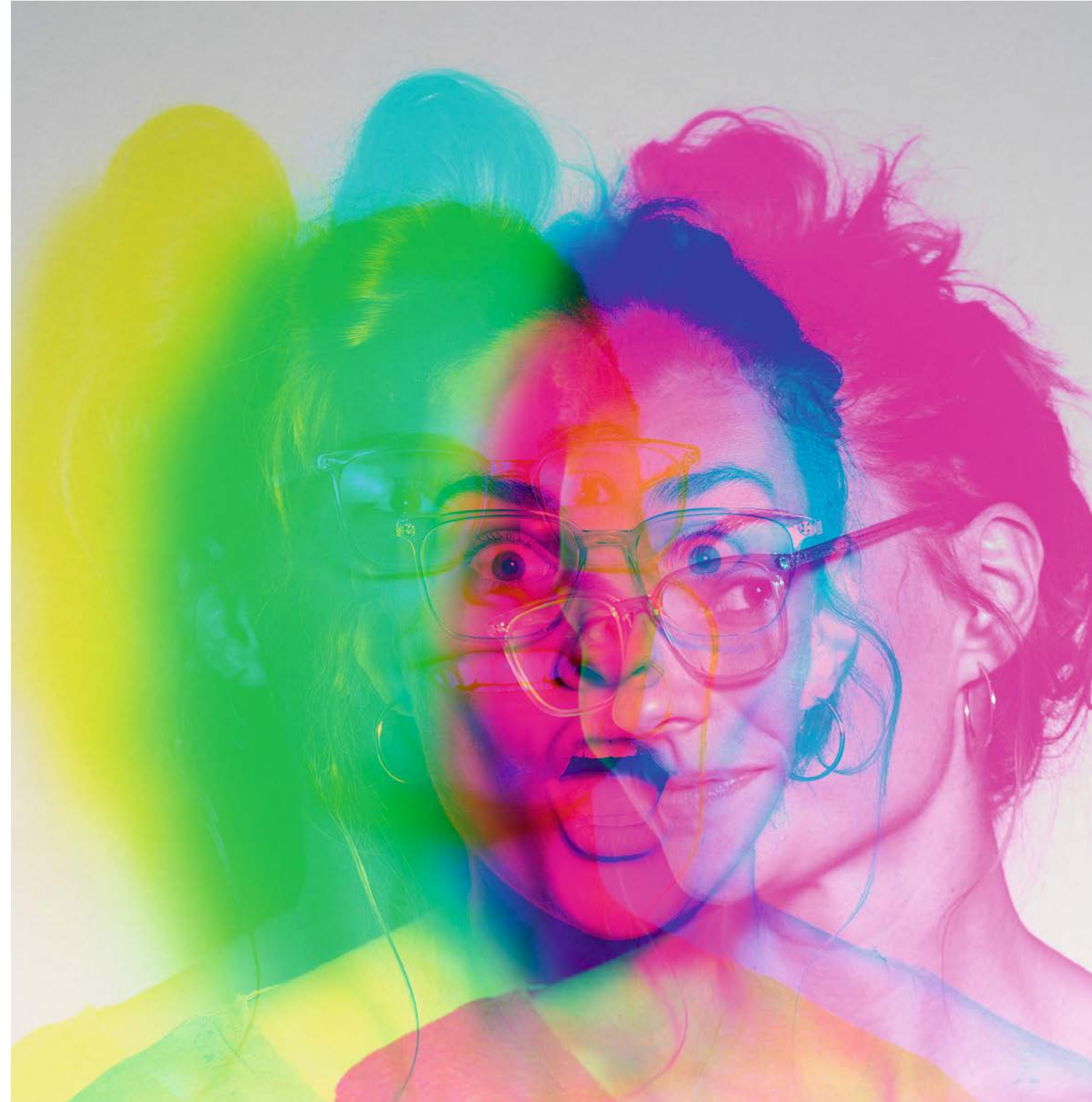
18 – 19